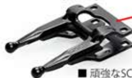
Ball tipped guard

■ 頑強なSCHガード上下にボルトで固定されています。 ボールチップバーは小枝と葉が蓄積するのを防ぎます。